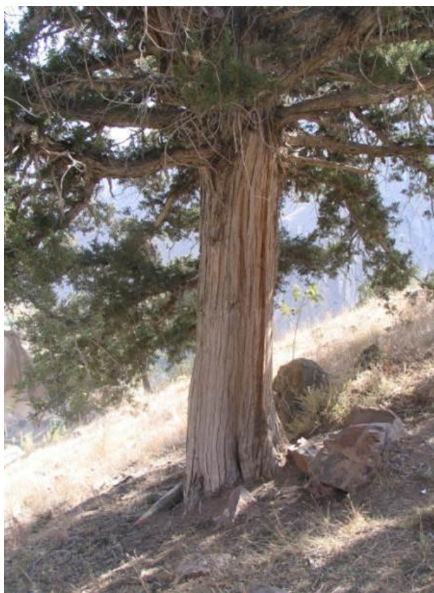
شکل ۳- گونه سرو کوهی

نمونه‌برداری در منطقه معرف ارس‌زارها، به صورت تصادفی - سیستماتیک صورت گرفت. جهت نمونه‌برداری و اندازه‌گیری خصوصیات گیاهی منطقه مورد مطالعه، ۳ ترانسکت ۳۰۰ متری در منطقه معرف مستقر و در طول هر ترانسکت ۱۰ پلات ۲۰ مترمربعی و در مجموع ۳۰ پلات پیاده شد. در هر پلات نام تک‌تک گونه‌ها، درصد پوشش و تعداد گونه، حضور و عدم حضور، زادآوری و همچنین درصد لاشبرگ، خاک لخت و درصد سنگ و سنگریزه محاسبه و برآورد شد. نتایج نشان داد که پوشش گیاهی گونه سرو کوهی برابر ۸/۶۳ درصد، تراکم آن برابر ۱/۸ پایه در ۲۰ مترمربع (۰/۰۹ پایه در مترمربع) بوده و در تمامی پلات‌های ۲۰ مترمربعی پایه ارس وجود داشت و درصد ترکیب آن نیز ۳۳/۸ بوده است. سرو کوهی در این رویشگاه از خصوصیات مورفولوژیک و شادابی قابل قبولی برخوردار بوده است (شکل‌های ۳ و ۴).