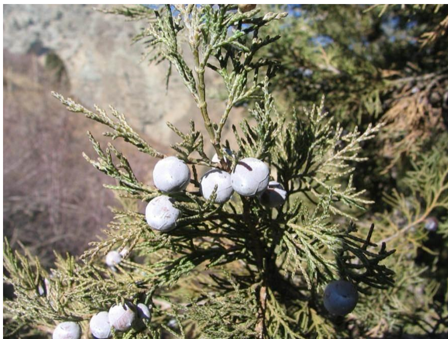
شکل ۴- میوه سرو کوهی

منطقه مورد مطالعه کوهستانی و دارای شیب‌های تند می‌باشد. جدول ۲، ویژگی‌های توپوگرافی منطقه مورد مطالعه را نشان می‌دهد. منطقه دارای شیب حداقل ۷ درصد، شیب حداکثر ۶۱ درصد و متوسط شیب ۳۴ درصد بوده و جهت غالب شیب، جنوبی می‌باشد. همچنین بیشترین درصد مساحت ارس‌زار در طبقه ارتفاعی ۲۴۰۰-۲۲۰۰ متر و کمترین درصد در طبقه ارتفاعی بیشتر از ۳۰۰۰ متر قرار دارد. در جدول ۳، ویژگی‌های اقلیمی منطقه مورد مطالعه بیان شده است.