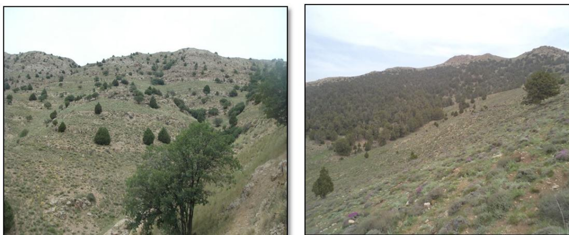
شکل ۲- نمایی از مراتع چهارباغ در استان گلستان

بر اساس لیست فلورستیک منطقه مورد بررسی، ۱۸۶ گونه گیاهی که اکثراً فرم رویشی بالشتکی و بوته‌ای دارند شناسایی شد. پوشش گیاهی به صورت بالشتکی، علفی و گندمی به همراه ارس‌های پراکنده می‌باشد. جدول ۱ ویژگی‌های تیپ‌های گیاهی منطقه مورد مطالعه را نشان می‌دهد. از بین ۵ تیپ گیاهی، تیپ Juniperus excelsa-Onobrychis cornuta- Stipa barbata با متوسط پوشش گیاهی ۲۵/۵ درصد، بیشترین مساحت (۳۰۵۹/۰۹ هکتار) را به خود اختصاص داده است. در این تیپ ارتفاع متوسط منطقه ۲۶۰۹ متر از سطح دریا و جهت غالب شیب، جنوبی می‌باشد. رویشگاه ارس به دلیل تنوع گیاهی دارای گیاهان دارویی، صنعتی و خوراکی همانند Berberis vulgaris ، Astragalus gossypinus ، Achillea millefolium ، Stachys inflata ، Rhamnus pallasii ، Onobrychis cornuta و Thymus kotschyanus و Centura echvaldii می‌باشد.