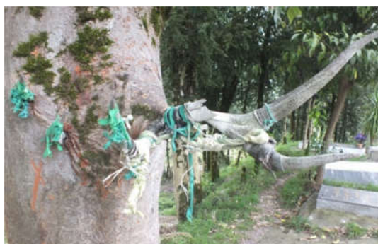
شکل ۱- درخت آزاد و شاخ‌گوزنی دخیل‌بسته در بقعه چهل‌ستون روستای "زاکله‌بر" لاهیجان،

(Arráf, 1993; Anabsi, 2008). در این میان در بسیاری موارد درختان مقدس با قبور قدیسن مرتبط بوده‌اند به نحوی که مردم از قدیسان آرمیده در پای درخت همواره طلب نعمت الهی، شفا و درمان بیماری‌ها و مجازات مجرمان می‌نمودند (Canaan, 1927; Dafni, 2007). در این رابطه Frese و Gray (۱۹۹۸) اشاره می‌کنند که در بسیاری از جوامع سنتی، درختان مقدس جایگاه مهمی برای برپایی آئین‌هایی مانند تولد، ازدواج، شفا و یا مرگ به‌شمار می‌آیند. او معتقد است روستایی درخت را به‌خاطر خودش و یا درخت بودنش ستایش نمی‌کند، بلکه آن را به‌دلیل قدرت الهی که در روح یک فرد خدایی آرمیده و در آن نهاده شده می‌پرستد (شکل ۱).