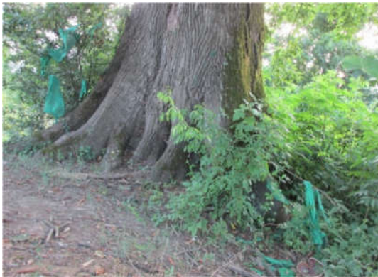
شکل ۵- دخیل بستن به درخت مقدس در یکی از روستاهای صومعه‌سرا

بررسی روابط همبستگی بین متغیرها نشان داد بین متغیر سن و متغیر بستن دخیل، رابط مثبت و معنی‌دار دیده شد (جدول ۵). بین متغیر سطح تحصیلات با متغیر ویژگی حاجت برآوردگی درخت رابطه منفی، بین متغیر سواد با متغیر نماد عظمت الهی بودن درخت، همبستگی مثبت دیده شد. همچنین روابط موصوف نشان داد که زنان بیش از مردان به ویژگی شفابخشی و توان حاجت برآوردگی درختان اعتقاد دارند (شکل ۵).