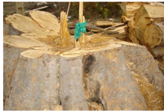
شکل ۴- درخت قطع شده در رضوانشهر به‌دستور رئیس وقت اداره کل اوقاف و امور خیریه گیلان (۱۳۸۷)

درختان به هر دلیلی قطع شوند یا بر اثر عوامل انسانی، حوادث طبیعی نظیر تغییرات اقلیمی و سیل، قطع یا از بین بروند، باز قابل احترام و محل توسل و تمسک آنان خواهند بود یا خیر؟ در پاسخ ۷۵ درصد به این پرسش، پاسخ مثبت، ۱۸/۴ درصد بدون نظر و ۱۰/۲ درصد نیز پاسخ منفی دادند (شکل ۴).