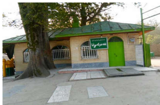
شکل ۲- بقعه سبزقبا و درخت کهنسالی با عنوان «درخت مزار» یا «آقادار»، روستای شنبه‌بازار فومن

استخراج و تولید چوب برای ساخت و ساز و سوخت، تهیه ذغال و ... از دلایل اصلی این جنگل‌زدایی بوده است این میراث گرانبها از زمان تمدن‌های بزرگ کاسی‌ها و هخامنشیان به ما ارث رسیده است. متأسفانه امروزه علیرغم داشتن پیشینه فرهنگی غنی و با وجود قوانین جدید، موسسات آموزشی و سازمان‌های اجرایی متعدد در کشورمان، نابودی جنگل‌ها و عدم توجه به محیط زیست همچنان وجود دارد (برخوردار، ۱۳۸۷). با وجود این در بخش‌های کوچکی از شمال کشور جنگل‌ها به واسطه مدیریت غیر رسمی مردم و جوامع محلی حفظ شده است. در این بخش‌ها مکان‌های مقدسی وجود دارند که عامل بقا و حفظ تنوع زیستی شده‌اند (شکل ۲). با توجه به آسیب‌های گسترده‌ای که به اکوسیستم‌های جنگلی وارد می‌شود، امروزه حفاظت از جنگل و ذخایر ژنتیکی آن از مهمترین موضوعات مورد بحث است.